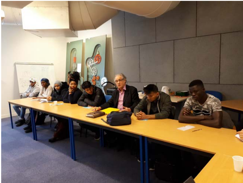
séminaire auprès des publics migrant

Le profil des participants était très divers - des professionnels qui travaillent avec les migrants au sein d'ONGs, un chargé d'études à l'OCDE qui travaille sur la migration et la diversité, des représentants de la Cité des Métiers (participant à d'autres projets européens Univercience et des responsables du label international) Ils ont été convaincus par l'approche MigrAID et par les productions intellectuelles présentées. En particulier la formation sera très utile pour leur pratique professionnelle. L'approche de la diversité est un sujet transversal qui est lié aux domaines de tous les participants.